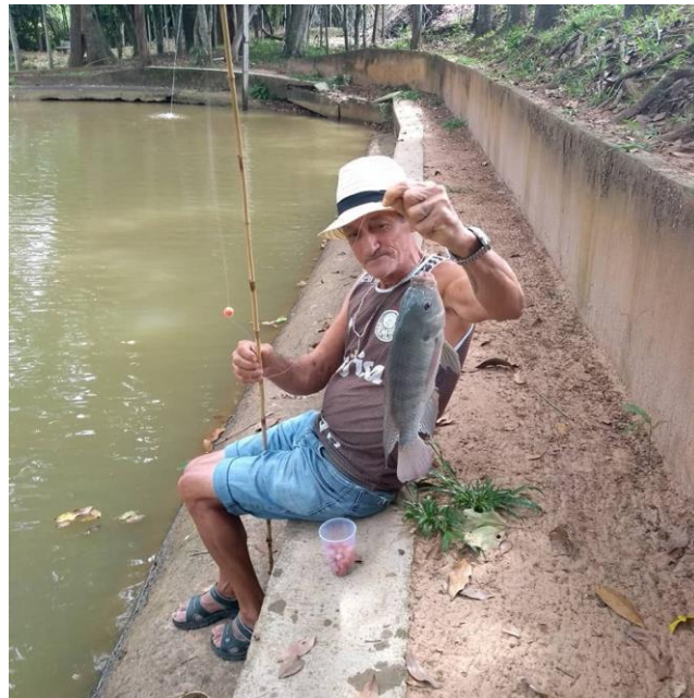
Atividades externas no território