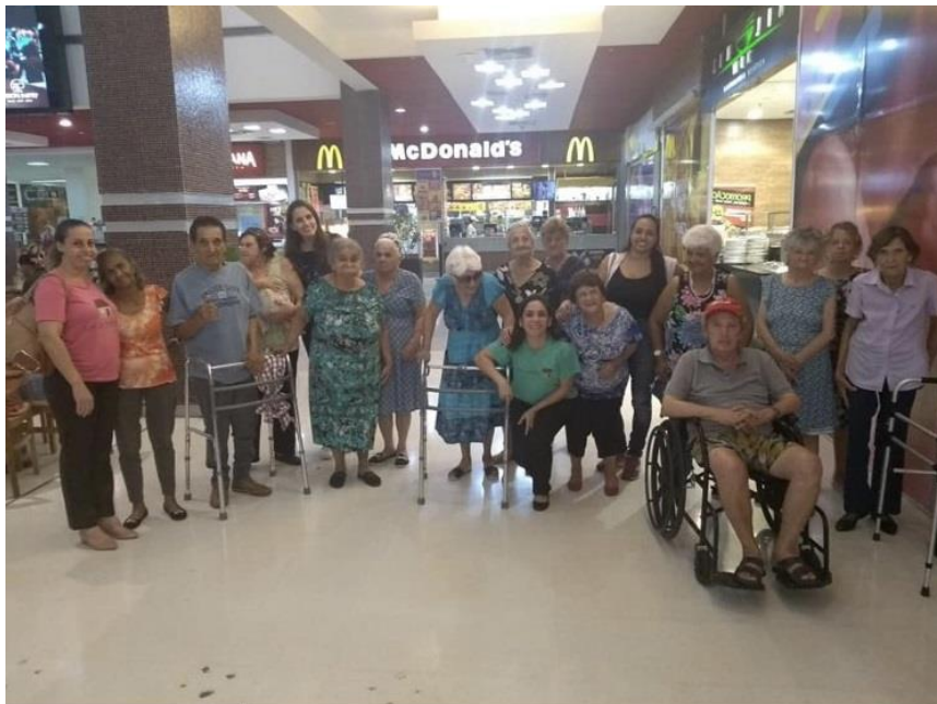
Atividades externas no território