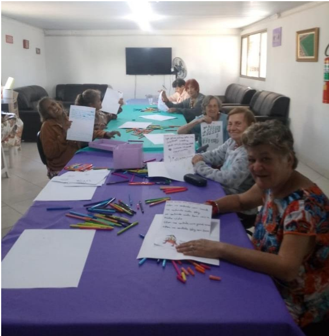
Oficina Lúdica: expressiva