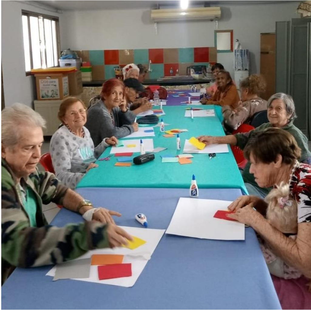
Oficina Lúdica: criatividade