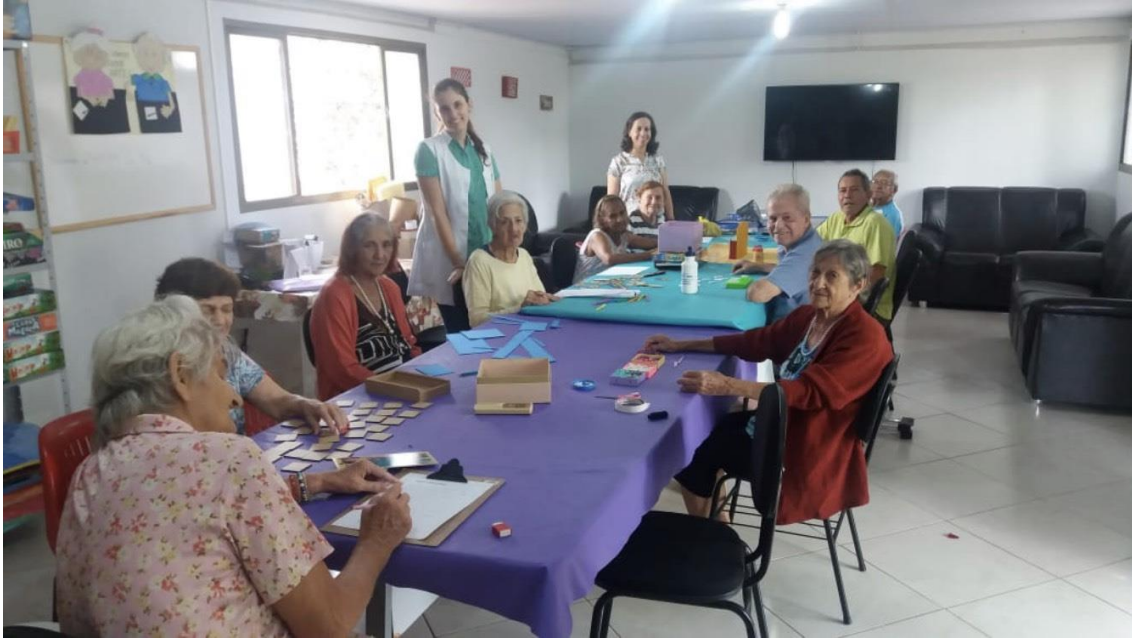
Oficina Lúdica: lazer