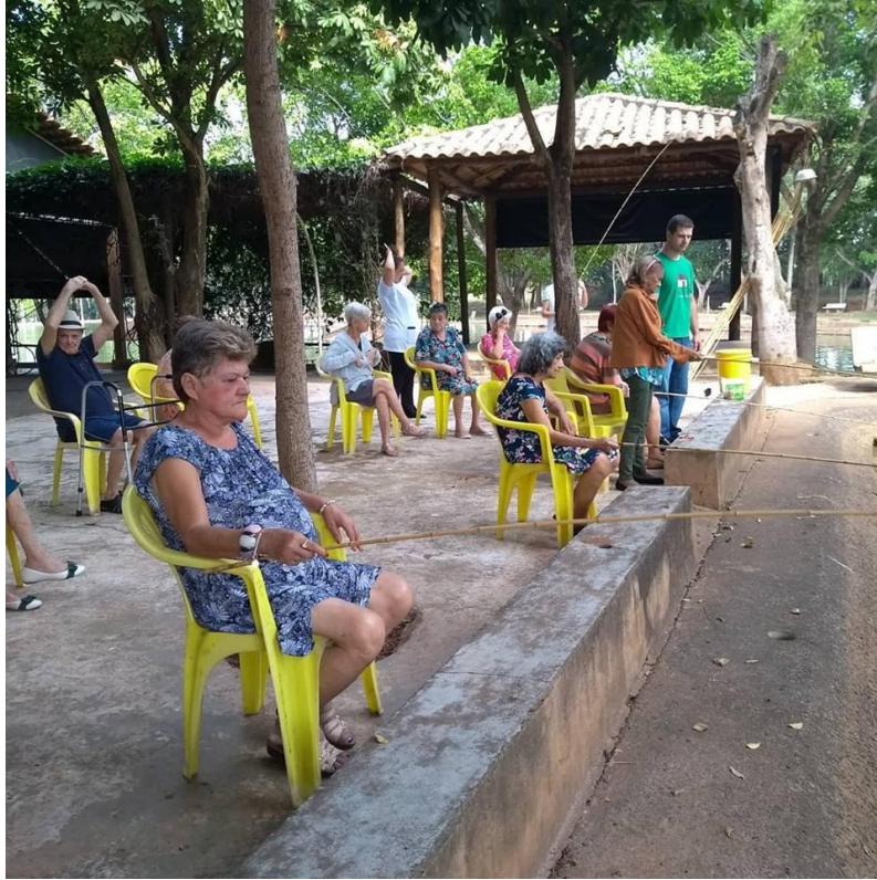
Atividades externas no território